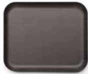
47 x 39 cm, Ref.: DG003