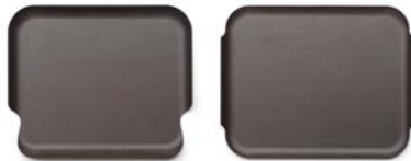
47 x 39 cm, Ref.: DG001 47 x 39 cm, Ref.: DG002