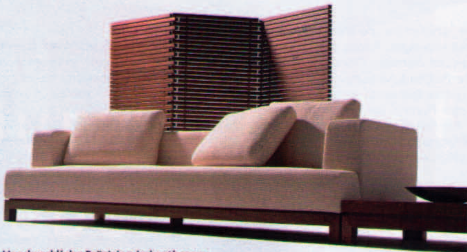
Handwerkliche Präzision in kostbarem Nussbaum: Sofa (ab 4000 Euro) und Paravent (ab 3000 Euro) aus der japanischen „Tosai“-Kollektion (Conde House). Adressen ab Seite 146

Mal Solist, mal Kombinationsgenie: Möbel aus HOLZ sind die geborenen Alleskönner