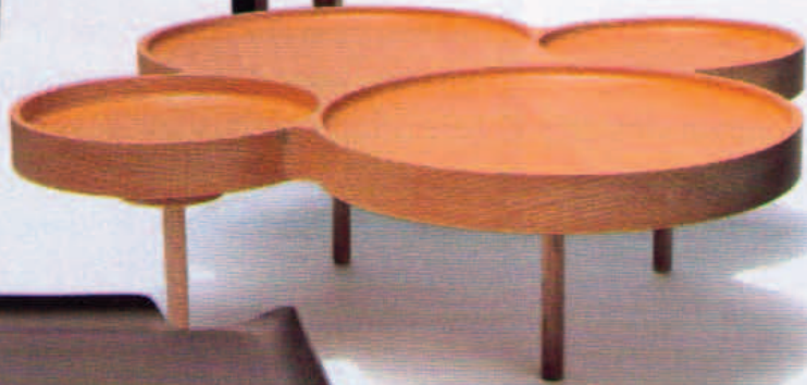
Couchtisch „Tapas“ aus vier scheinbar ineinandergeschobenen Buchenholztellern (P. B. Berger, ca. 393 Euro).