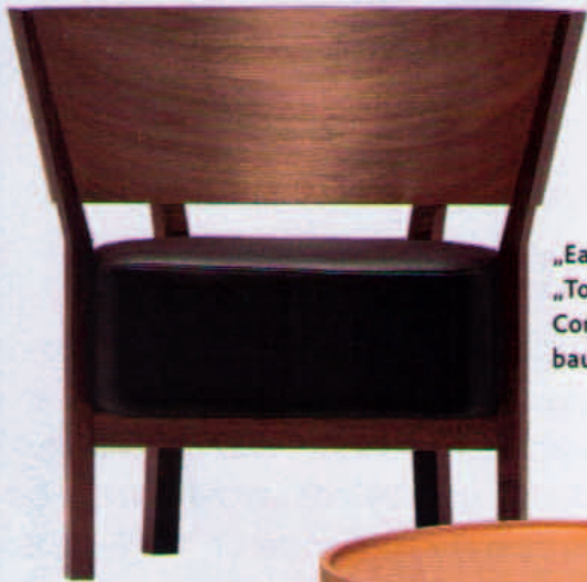
„Easy Chair“ aus der „Tosai“-Kollektion von Conde House. In Nussbaum ca. 1300 Euro.