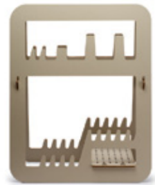
ESCURREPLATOS / DISH RACK 44 x 55 x 20 cm. Ref. 25EP