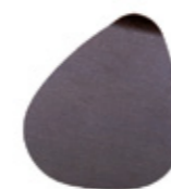
SALVAMANTELES / PLACEMATS 34 x 30 cm. Ref.: 22SM