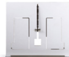
ATRIL AGUS / AGUS BOOK STAND 370 x 320 mm. Ref. 30AG00