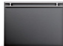
VADE 3 ALAMEDA / ALAMEDA 3 DESK BLOTTER 470 x 350 mm. Ref. 30VA03