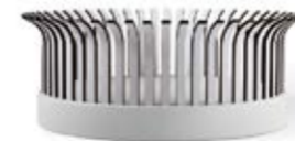
CENTRO MESA 2 CANASTA / 2 CANASTA CENTERPIECE TRAY Altura / height: 120 mm. Ref. 30CM1B