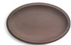
ACABADO LISO / SMOOTH FINISH 60 x 40 cm. Ref. 24MO