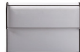
CAJA 1 KUTXA / KUTXA 1 BOX 350 x 245 x 140 mm. Ref. 30CJ01