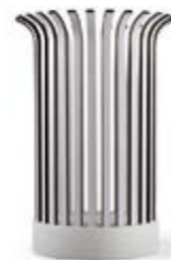
CENTRO MESA 1 CANASTO / 1 CANASTO CENTERPIECE TRAY Altura / height: 300 mm. Ref. 30CM1A