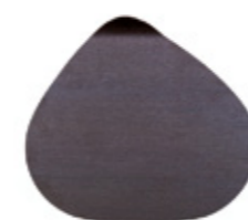
BAJOPLATO / PLATE CHARGERS 36 x 40 cm. Ref.: 22BP