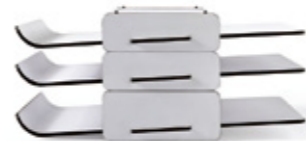
BANDEJA CORRESPONDENCIA / LETTER TRAY Altura / height: 40 / 60 mm. Ref. 30MJ01 / 30MJ02