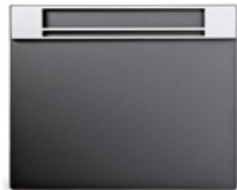
VADE 2 VALLE / VALLE 2 DESK BLOTTER 600 x 486 mm. Ref. 30VA02