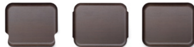
47 x 39 cm. Ref.: DG001