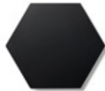
SALVAMANTELES / TRIVETS 25 x 21 cm.