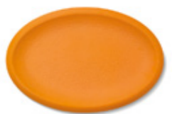
ACABADO MARTELÉ / HAMMERED FINISH 60 x 40 cm. Ref. 24MO

Su vocación de servicio, la sensualidad de su perfil ondulado, la calidez natural de la madera, su serena presencia, hacen de la bandeja Mö el complemento ideal en el hogar aunando modernidad y tradición