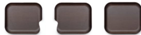
35 x 30 cm. Ref.: DP001