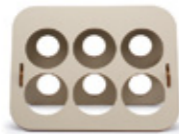
BOTELLERO / BOTTLE RACK 35 x 17 x 16 cm. Ref. 25BT