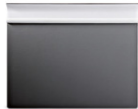
VADE 1 NAVE / NAVE 1 DESK BLOTTER 600 x 485 mm. Ref. 30VA01